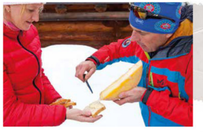
Racletten in de buitenlucht, wat wil een mens nog meer?

Het is alweer dag vier als we later in de middag bij de Col de Fenestral aankomen. We zijn op weg naar de jagershut Tzantapolet, gezang van de haan. Want die leven hier, wilde hanen, net als herten, berggeiten en zelfs lynxen. De afgelopen dagen hebben we verschillende dieren en talloze sporen gezien. Het grappigste is wel die van een wild zwijn.