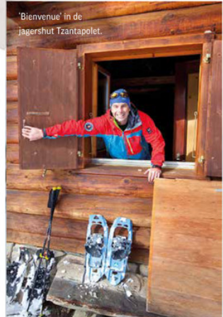
'Bienvenue' in de jagershut Tzantapolet.