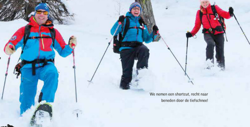
We nemen een shortcut, recht naar beneden door de tiefsneeuw!

Is een huttentocht voorbehouden aan de zomer? Nee hoor, 's winter trek je gewoon je sneeuwschoenen aan.