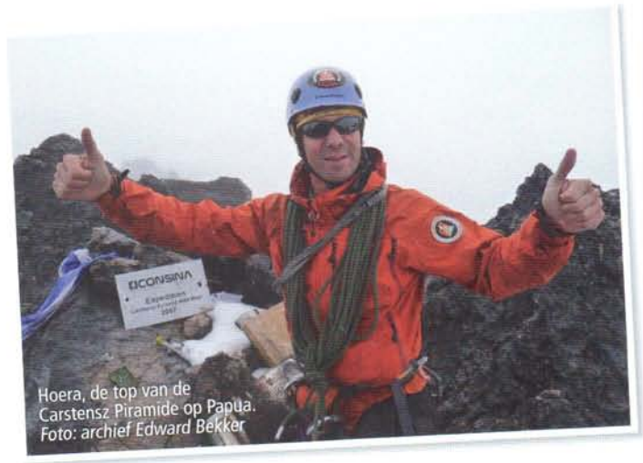
Hoera, de top van de Carstensz Piramide op Papua.

Dat zal te maken hebben met de mind-set . Ze hebben iets avontuurlijks en klimmen tot ze kinderen krijgen. Na hun dertigste zie je ze niet meer. Later, als de kinderen groot zijn, komen ze vaak weer terug."