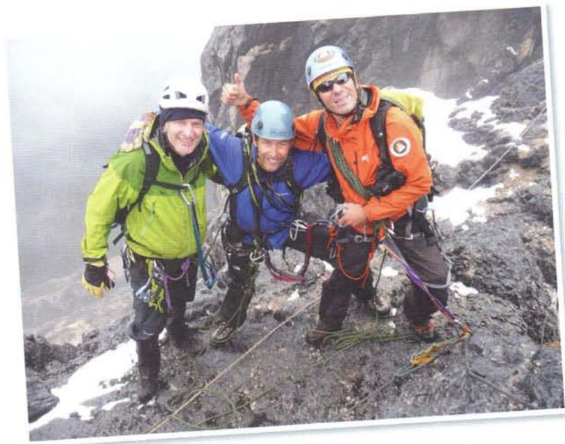
↑ De berggids in actie met zijn klanten.

Het welbevinden van zijn gast ligt hem na aan het hart. "Als je gids bent, is het de bedoeling dat je met je klant op de top komt, of dat je hem met skiën veilig door lawinegevaarlijk terrein loodst. Leuk als je zelf ook een topje beklimt, maar dat is niet de intentie."